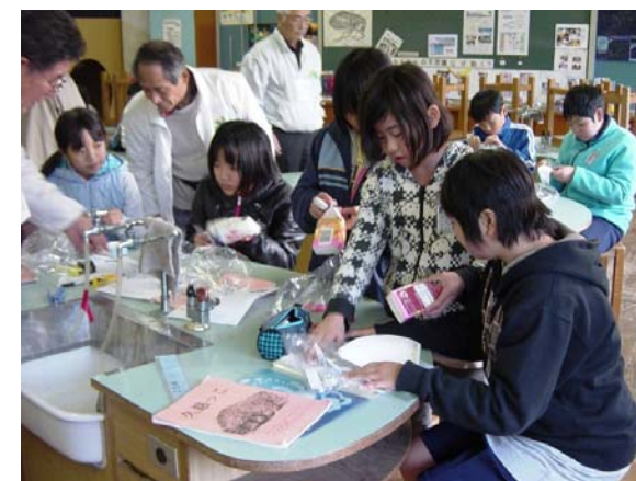
アルミテープで船体をシール