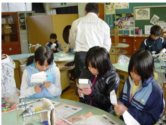
牛乳パックで船体づくり

久慈小科学クラブ（4～6年生）のポンポン船づくりの出前教室。 ポンポン船の走る原理を説明後、製作にかかり全員上手に完成させる。 進水し走行する船に感動。“ウオー！！”と歓声があがる。