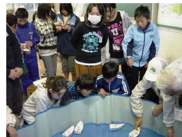
走行する船に歓声！！